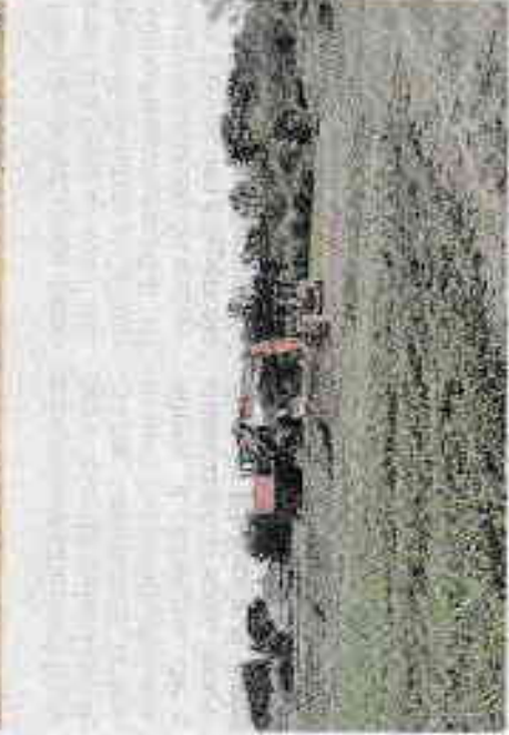
Le foto di Legambiente sui lavori di piantumazione di nuovi vigneti

GIAVERA Un'antica ferrovia rimossa a Gaverana, i boschi abbattuti sul Montello, a Vittorio Veneto una zona protetta scavata. Tutto per lasciare spazio ai vigneti. La denuncia sul nuovo consumo di suolo a favore della produzione vinicola arriva da Legambiente, che insieme al Wwf e alle associazioni Sos anfi e Amici del bosco del Montello, ha organizzato un'assemblea pubblica giovedì alle 20.45 a villa Wassermann.