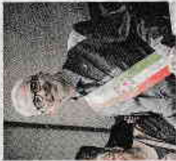
IL SINDACO ROBERTO TONON CERCHERÀ DI INCONTRO I PROPRIETARI DEL TERRENO

In questi giorni i genitori stanno raccogliendo firme davanti alla scuola Nazario Sauro, in via Cal de Livera, ai cancelli di San Fermo, e davanti alla pasticceria Dolomiti in piazza Fiume, sempre a San Giacomo. Si passerà, poi, al porta-a-porta. La grande paura è quella dei trattamenti chimici. «L'esposizione ai pesticidi, anche all'interno dei parametri di legge, espone a gravi pericoli la salute di chi è in prossimità delle aree ove tali sostanze vengono irrorate e, in particolare, delle fasce più vulnerabili come i bambini - affermano i genitori -. Gli effetti delle sostanze agrotossiche, infatti, sono misurate in mg/kg di peso corporeo: per cui tanto minore è il peso, tanto maggiori saranno gli effetti nocivi». Siccome le soglie giornaliere vengono calcolate sul peso di un adulto, i nostri bambini, che vanno dai tre ai sei anni, sono esposti ad un notevole rischio». Ad allarmare c'è anche l'elemento della siepe. Ce n'era già una, ma è stata rasa al suolo. —